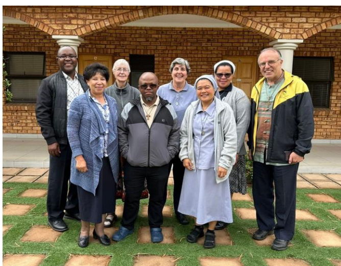
Rada LCCL - celostátní sdružení řeholníků: zastupuje 10 řeholních společenství, 2100 zasvěcených mužů a žen