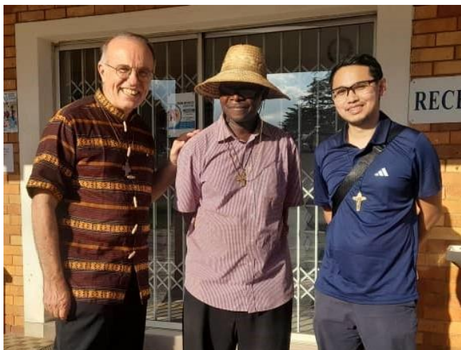
Příjezd P. Rica z Filipín jednoho ze tří nových misionářů

misionářů (z Čadu, Nigérie a Filipín), dva z nich jsou právě čerstvě vysvěcení kněží a budou nám hodně pomáhat.