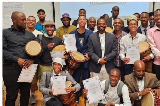
Ukončení studia (12. třída) Kapské Město

Srdečné pozdravy z Kapského Města v Jihoafrické republice, našeho 130 let starého mateřského domu, zvaného Salesian Institute. V Jižní Africe vrcholí léto se všemi nepředvídatelnými zvraty globálních klimatických změn a všech 18 salesiánských škol má již měsíc prázdniny.