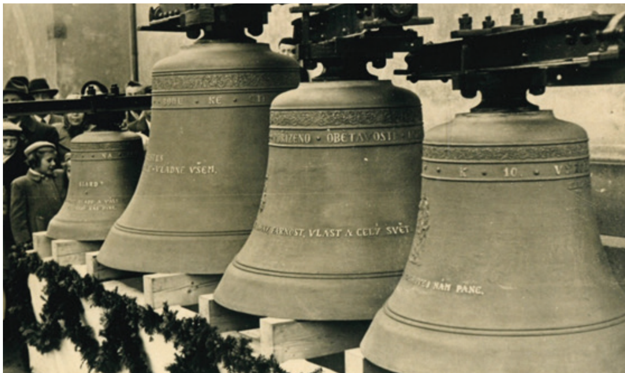
obr. 2 | Naše farní zvony (zleva) – Siard, Kristus Král, Panna Maria, Cyril a Metoděj