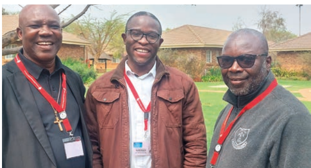
obr. 1–5 | JOINTWITNESS (Společné svědectví) – tříleté setkání biskupů a řeholníků z Jižní Afriky (eMseni-Johannesburg, 16.–18. září 2024)