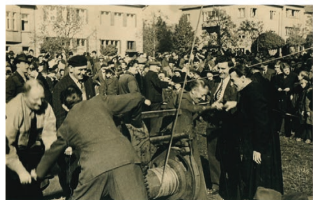
obr. 1 | Vrátek pro vytahování zvonů, v pozadí domy na ulici Hrozňatova