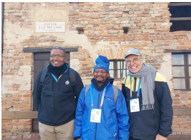
Delegáti u rodného domu Dona Bosca v Becchi

původem z Eswatini) se snažíme oslovit mnoho dalších salesiánských provincií, abychom se učili, získali podporu, vyměňovali si zkušenosti z formací laických misijních partnerů, se středisky mládeže, s přípravou na misie nebo si vyměňovali materiály, know-how či začali navazovat kontakty.