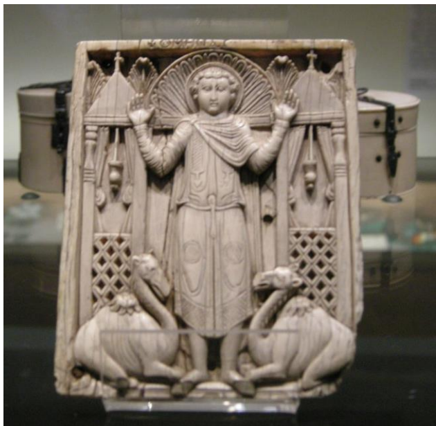
Svatý Menas, slonovinová řezba, 2. pol. 7. století,

Mučedník narozen ve 3. století (?) v Egyptě. Zemřel r. 295 (?) v Egyptě (?).