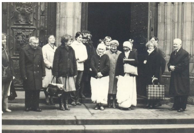
Matka Tereza při návštěvě Prahy v roce 1984

nemá cukr. Toto dítě přišlo domů a řeklo svým rodičům: „Já nebudu jíst cukr 3 dny a chci ho dát Matce Tereze.“ Toto malé dítě milovalo velikou láskou, protože darovalo, co mělo. Hlad není jenom po chlebu, je také hlad po lásce, po Božím Slově. Nahota není jen nedostatek oděvu, nahota je také ztráta důstojnosti, čistoty, ztráta míru. Bezdomovectví není jen nedostatek domu z cihel, bezdomovectví je také být vyvržen, nemilován, vyhnán, prostě vyřazen ze společnosti. V dnešní době, kdy každý je tak zaměstnán, mnoho lidí je velmi osamělých, prostě nechtěných. Tam právě má přicházet vaše láska,“ řekla Matka Tereza.