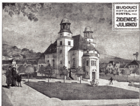
Původní návrh kostela

do Vinohradů do klubovny. „My jsme se chodili schovávat do pískového lomu vedle hřbitova. Nebo jsme chodili za tu lávku, co vede z Vinohradů na druhou stranu, tam je borový les, tomu se říká Borky,“ vypráví o válečných útrapách paní Klementová.